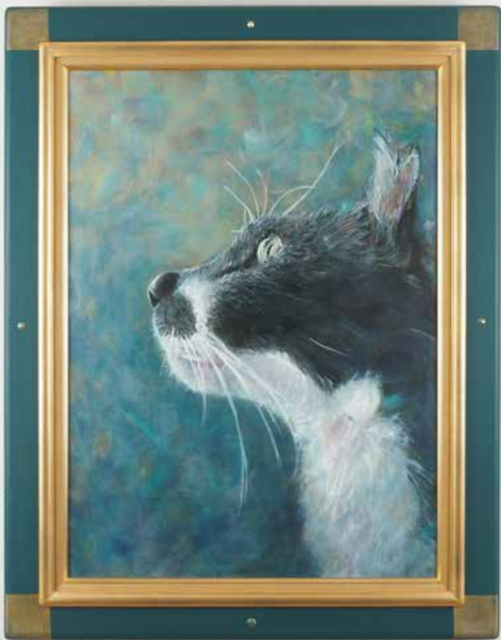
赤い涙 - 2023/P20/Acrylic